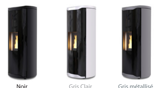
Noir Gris Clair Gris métallisé